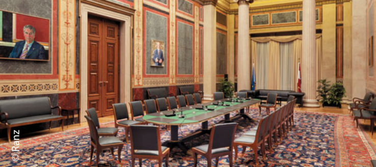
Priėmimų salė (prezidento salonas)