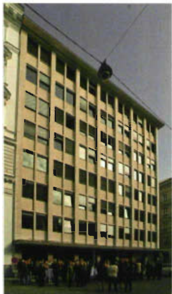
Kunstsektion des BMUKK, Concordiaplatz 2, 1010 Wien

Die mit der Kunstförderung betraute Sektion war in den vergangenen Jahren verschiedenen Ministerien zugeteilt. 1996 befand sie sich als Sektion III beim Bundesministerium für Wissenschaft, Forschung und Kunst (BMWFK), das seit 1. Mai 1996 gemäß Art. 91 N des Bundesgesetzes BGBl. Nr. 201/1996 Bundesministerium für Wissenschaft, Verkehr und Kunst (BMWVK) hieß. Seit 1997 ressortierte die Kunstsektion als Sektion II beim Bundeskanzleramt. Mit 1. März 2007 gehört sie als Sektion VI dem Bundesministerium für Unterricht, Kunst und Kultur (BMUKK) an.