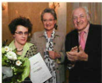
Olga Neuwirth erhält den Großen Österreichischen Staatspreis von Bundesministerin Dr. Claudia Schmied und em. Univ. Prof. Mag. Hans Hollein, Präsident des Österreichischen Kunstsenats

„Zur Würdigung besonders hervorragender Persönlichkeiten auf dem Gebiet der österreichischen Kunst und zur fachlichen Beratung des Bundesministeriums für Unterricht in Fragen der staatlichen Kunstverwaltung“ wurde per Erlass des zuständigen Bundesministeriums vom 7. September 1954 der Österreichische Kunstsenat eingerichtet. Der aus 21 Mitgliedern bestehende Kunstsenat nominiert jährlich eine künstlerische Persönlichkeit für den Großen Österreichischen Staatspreis (→ Preise ) und wählt aus dem Kreis der StaatspreisträgerInnen die neuen Mitglieder des Senats.