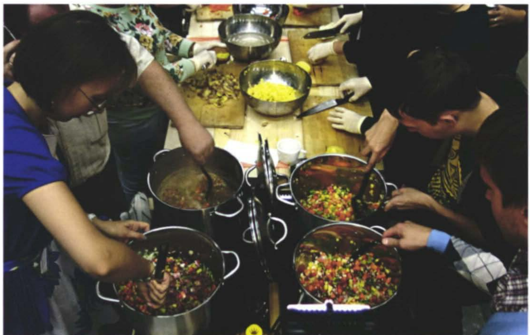
Desiring the Real, Nishny Novgorod, Lunchbox Performance, Rainer Prohaska © Rainer Prohaska

Das Gedenkjahr 1914–2014 war Anlass für das BKA, eine Reihe von europaweiten Projekten im Bereich zeitgenössischer Kunst durchzuführen. So wurde mit Unterstützung durch die Stiftung Sarajewo – Herz Europas und damit der Europäischen Union das österreichische Kunstprojekt SHARE – Too Much History – MORE Future entwickelt. KünstlerInnen aus Bosnien und Österreich wurden eingeladen, Videoarbeiten zu zeigen, die Erinnerungen (persönliche wie kollektive) und Fragen nach dem Hier und Jetzt auf unterschiedlichste Art und Weise thematisieren. SHARE – Too Much History – MORE Future wurde in unterschiedlichen Formaten (Ausstellungen, Videoscreenings, Podiumsdiskussionen) in folgenden Ländern durchgeführt: Bosnien und Herzegowina, Slowenien, Serbien, Kroatien, Österreich und Deutschland.