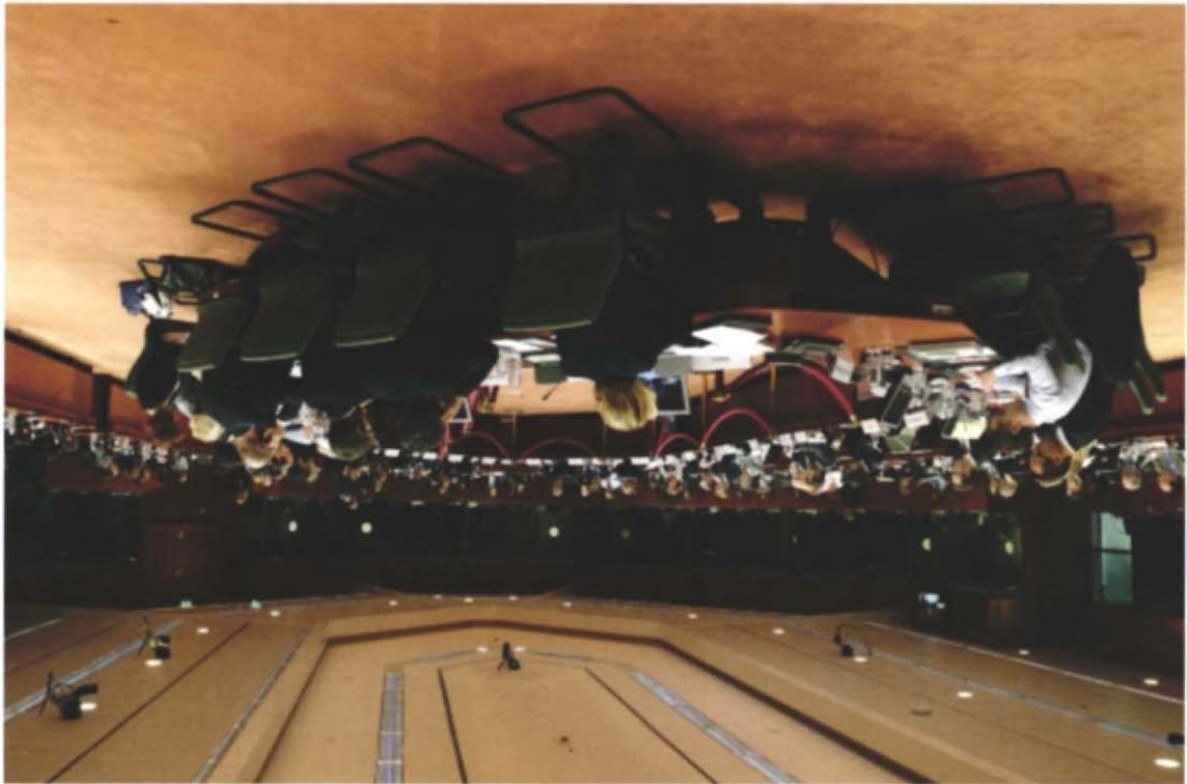
25. November 2014 in Brüssel. EU-KulturministerInnenrat am