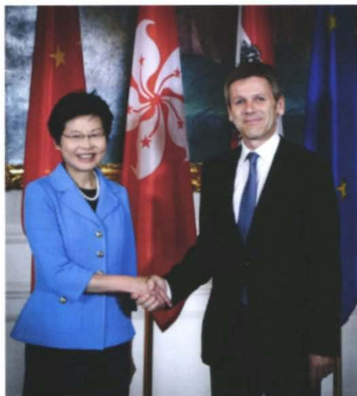
Stv. Regierungschefin der Sonderverwaltungsregion Hongkong, Carrie Lam Cheng Yuet Ngor und Bundesminister Dr. Josef Ostermayer

Im Rahmen der Umsetzung der bestehenden Kulturabkommen und Arbeitsprogramme wurden Kunstschaffende und ExpertInnen nach Österreich eingeladen. So hielt sich etwa im Oktober eine Delegation von LiteratInnen auf Einladung des BKA zu einem Studienbesuch in Österreich auf.