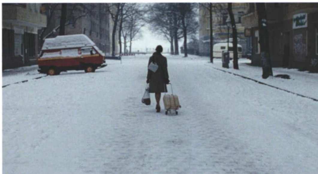
Share, Sella Kamerić Gluck

Der Austausch von KünstlerInnen hat sich vervielfacht, zahlreiche Projekte und Kooperationen im Bereich zeitgenössischer Kunst und des kulturellen Erbes konnten ins Leben gerufen bzw. vertieft werden.