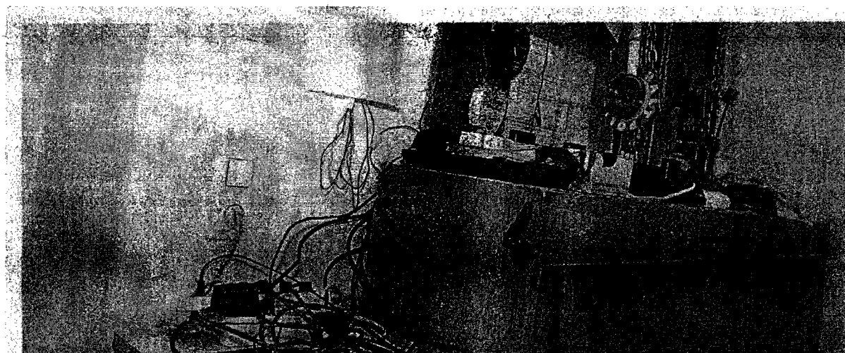
Desolates Wachzimmer in Wien: In der Vergangenheit halfen die Polizeifreunde bei der Revolverung. Künftig muss das Innenministerium zahlen.

Im Zuge einer Prüfung stellte der Rechnungshof in seinem Bericht III-48 diverse Missstände in der Verwaltung und Bewirtschaftung von Gebäuden, Anlagen und Einrichtungen in Bereichen des Bundesministeriums für europäische und internationale Angelegenheiten fest. Da nicht auszuschließen ist, dass auch im Bundesministerium für Inneres diesbezüglich Missstände bestehen und dem Begleittext zu einem Foto in der Tageszeitung „Die Presse“ vom 7.11.2007