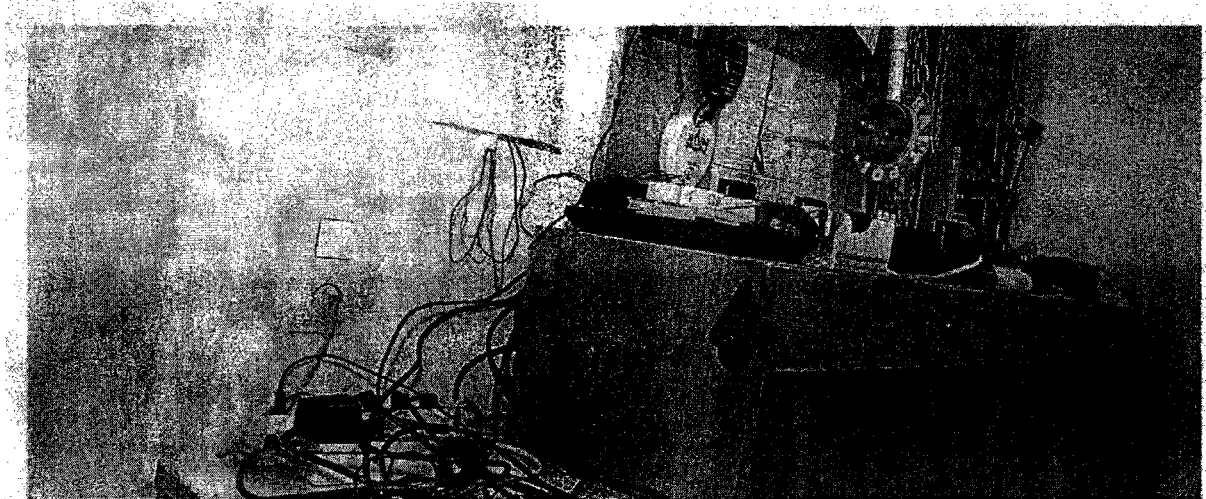
Desolates Wachzimmer in Wien: In der Vergangenheit halfen die Polizeifreunde bei der Renovierung. Künftig muss das Innenministerium zahlen.

Im Zuge einer Prüfung stellte der Rechnungshof in seinem Bericht III-48 diverse Missstände in der Verwaltung und Bewirtschaftung von Gebäuden, Anlagen und Einrichtungen in Bereichen des Bundesministeriums für europäische und internationale Angelegenheiten fest. Da nicht auszuschließen ist, dass auch im Bundesministerium für Inneres diesbezüglich Missstände bestehen und dem Begleittext zu einem Foto in der Tageszeitung „Die Presse“ vom 7.11.2007