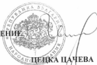
ТЪЦКА ТЪЧЕВА ПРЕДСЕДАТЕЛ НА НАРОДНОТО СЪБРАНИЕ НА РЕПУБЛИКА БЪЛГАРИЯ