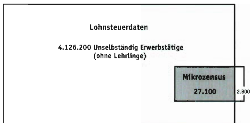
Grafik 36: Unselbständig Erwerbstätige (ohne Lehrlinge) 2013 Lohnsteuerdaten × Mikrozensus

Die Schnittmenge LSt × MZ besteht somit aus allen unselbständig Erwerbstätigen (ab 15 Jahren mit Wohnsitz in Österreich, ohne Lehrlinge), die im Bezugsjahr in mindestens einem Quartal im Mikrozensus befragt und im Verknüpfungsvorgang in den Lohnsteuerdaten gefunden werden konnten (vgl. Grafik 36).