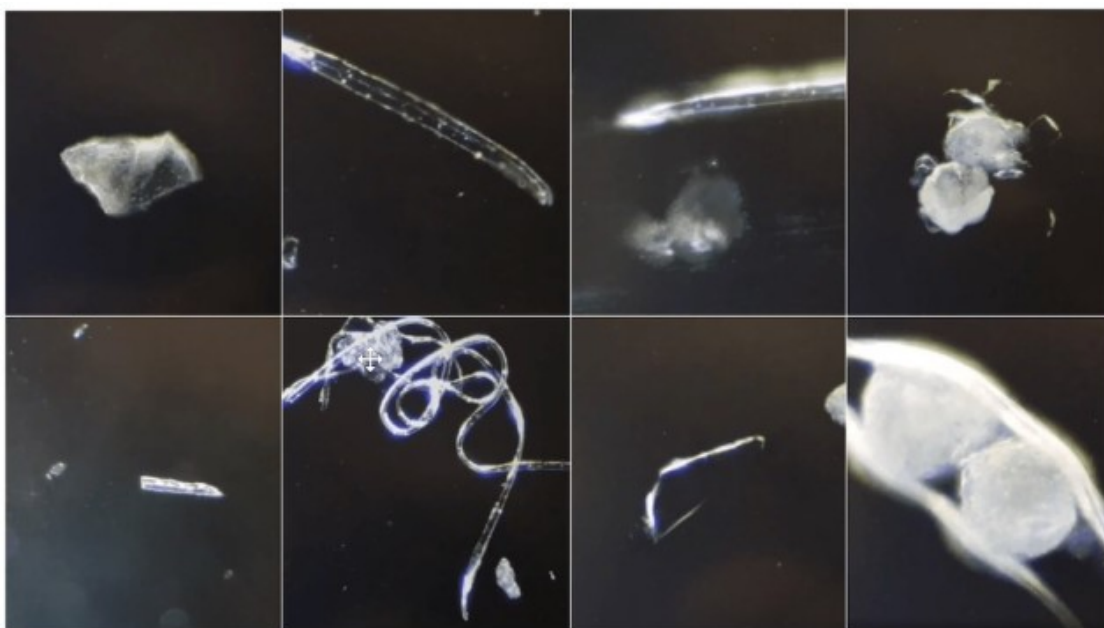
Eigenartige Strukturen im Blut von Covid-19-Geimpften

Insgesamt stellten sie aufgrund der Untersuchungen vieler geimpfter Menschen fest, dass es „eindeutig große Unterschiede im Blut von geimpften und ungeimpften Menschen gibt“. Was für die Forscher besonders beunruhigend war: Speziell nach Impfungen mit BioNTech/Pfizer und Moderna fielen ihnen eigenartige Strukturen im Blut auf, die sie bis dahin noch nie gesehen hatten, unter anderem rechteckige und quadratische Kristallformen sowie Spiralen. Außerdem förderten die mikroskopischen Blut-Analysen auffällig verformte Membranen von roten Blutkörperchen zutage, wie sie sonst nur bei Menschen mit schweren Erkrankungen zu beobachten sind. Die Forscher stießen aber auch häufig auf Blutverklumpungen. Darüber hinaus stellten sie wiederholt ein vermindertes Fließvermögen des Blutes bei Geimpften fest.