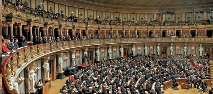
Der Historische Sitzungssaal