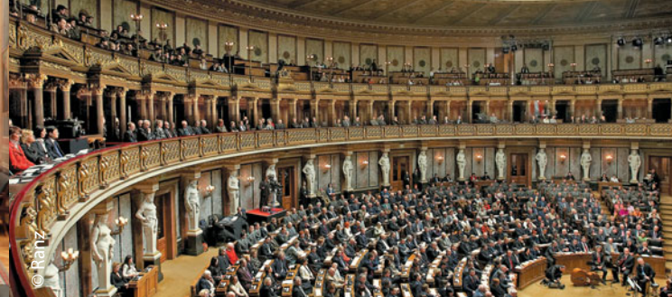
Η ιστορική αίθουσα συνεδριάσεων