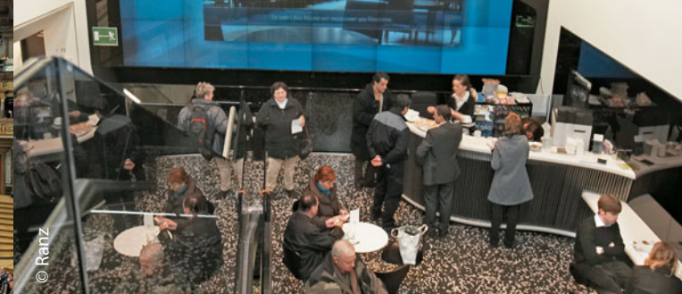
Το κέντρο επισκεπτών