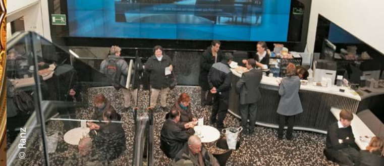
Le Centre des visiteurs