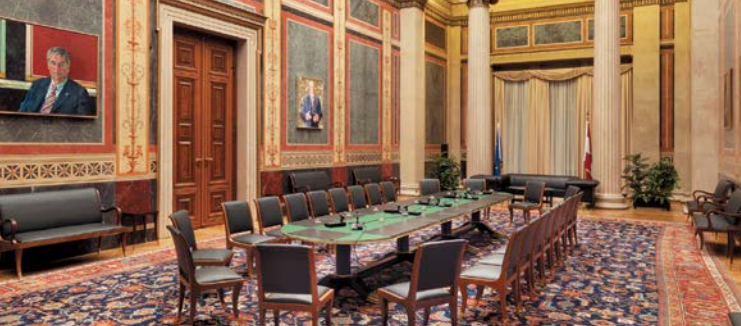
Le salon de réception (Salon présidentiel)