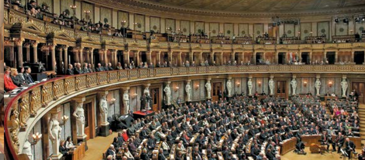
La salle plénière historique