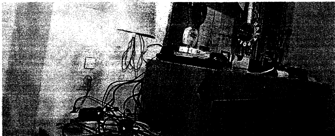
Desolates Wachzimmer in Wien: In der Vergangenheit halfen die Polizeifreunde bei der Renovierung. Künftig muss das Innenministerium zahlen.

Im Zuge einer Prüfung stellte der Rechnungshof in seinem Bericht III-48 diverse Missstände in der Verwaltung und Bewirtschaftung von Gebäuden, Anlagen und Einrichtungen in Bereichen des Bundesministeriums für europäische und internationale Angelegenheiten fest. Da nicht auszuschließen ist, dass auch im Bundesministerium für Inneres diesbezüglich Missstände bestehen und dem Begleittext zu einem Foto in der Tageszeitung „Die Presse“ vom 7.11.2007