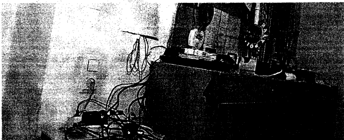
Desolates Wachzimmer in Wien: In der Vergangenheit halfen die Polizeifreunde bei der Renovierung. Künftig muss das Innenministerium zahlen.

Im Zuge einer Prüfung stellte der Rechnungshof in seinem Bericht III-48 diverse Missstände in der Verwaltung und Bewirtschaftung von Gebäuden, Anlagen und Einrichtungen in Bereichen des Bundesministeriums für europäische und internationale Angelegenheiten fest. Da nicht auszuschließen ist, dass auch im Bundesministerium für Inneres diesbezüglich Missstände bestehen und dem Begleittext zu einem Foto in der Tageszeitung „Die Presse“ vom 7.11.2007