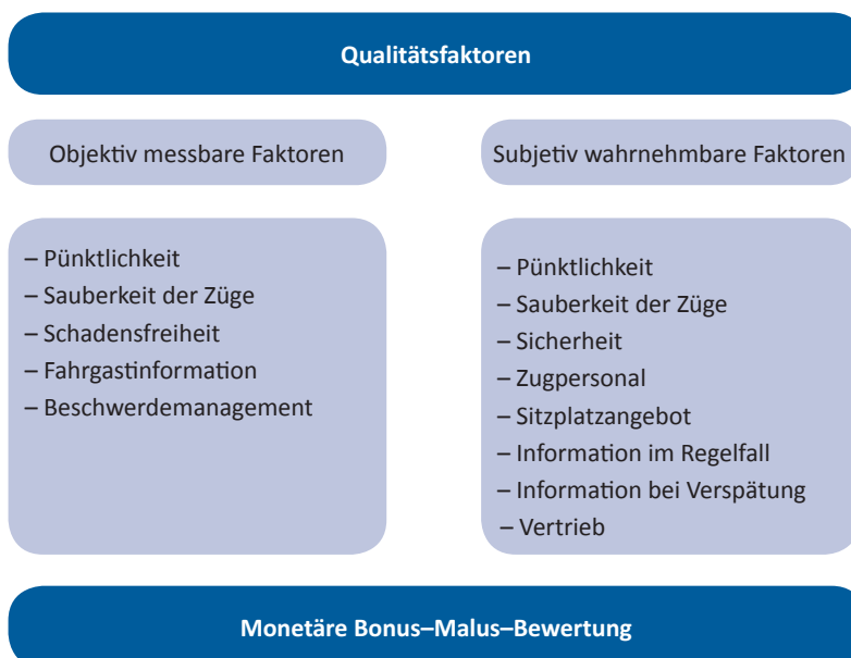
Abbildung 3: Qualitätsfaktoren

Die qualitativen und quantitativen Qualitätsfaktoren lauteten im Detail: