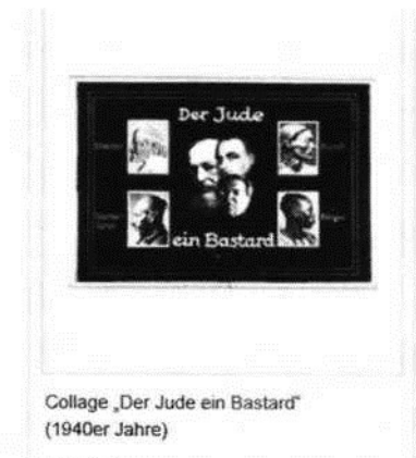
Abbildung 2 | Quelle: http://de.metapedia.org/wiki/J%C3%BCdische_Rasse (abgerufen am 6. März 2018)

Darstellung der Rassenmischung der Juden in „Das Judentum, seine blutsgebundene Wesensart in Vergangenheit und Gegenwart“: