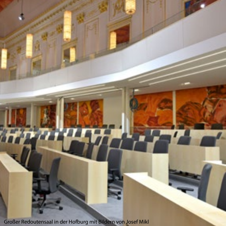
Großer Redoutensaal in der Hofburg mit Bildern von Josef Miki

Bitte beachten Sie, dass an Sonntagen und Feiertagen keine Führungen stattfinden. Zudem gibt es aufgrund der Notwendigkeiten des parlamentarischen Betriebs speziell festgelegte Tage ohne Führungen.