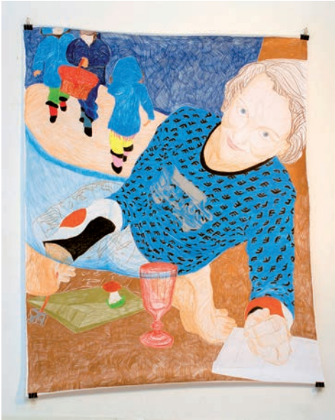
Keimzelle des Staates 100, 2007 Buntstift auf Papier 200 x 176 cm