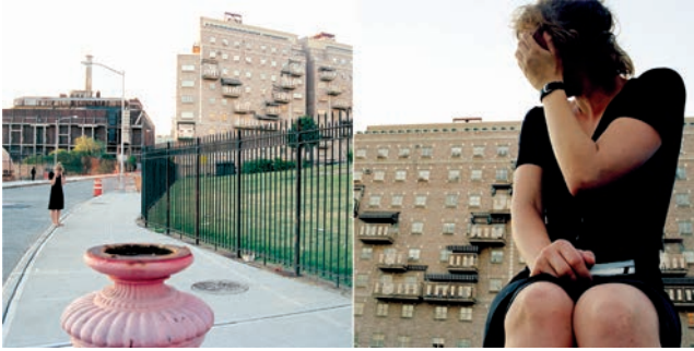
„Let this be a dream. NY Times, July 23, 2006“, 2008 2 C-Prints 60 x 60 cm