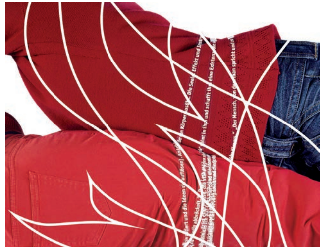
O.T., (aus der Serie Cut-Out), 2007 3 C-Prints auf Dibond kaschirt, digitale Cuts, Acrylglas, gerahmt je 72 x 92 cm

Die in Bulgarien geborene Künstlerin setzt in ihren Zeichnungen Schraffuren ein, die sich wie gerissene Papierstückchen unterschiedlicher Größe und Grauwerte zu einem virtuos, bruchstückhaften Gefüge zusammenschließen. Die formale Nähe zur Collage wie auch die Zurücknahme des Gestischen irritieren die geläufige Vorstellung von Zeichnung als unmittelbarer Ausdruck des schöpferischen Menschen. Auf der delikats gestalteten Oberfläche der Arbeit 08_Narzisse versammeln sich florale Elemente, ein lachender Teddy und ein durch Linien angedeuteter Stuhl ebenso wie der Torso eines nackten weiblichen Oberkörpers und eine melancholisch tanzende Figur eines jungen Mädchens. In der Arbeit Teddy_01 umreißen dünne Konturen das Stofftier als fragiles Wesen mit abgerissenen Beinchen. Schlieren formen eine knieende Figur, deren hängender Kopf sich in einer weißen Fläche auflöst. Als narrative Zeichen verweisen diese Sujets auf außerhalb des Mediums stattfindende Ereignisse, die die BetrachterInnen mit ihrer subjektiven Geschichte zu verweben beginnen.