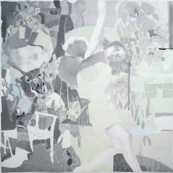
08_Narzisse, 2009 Graphitstift und farbige Kreide auf Zeichenkarton 150 x 150 cm