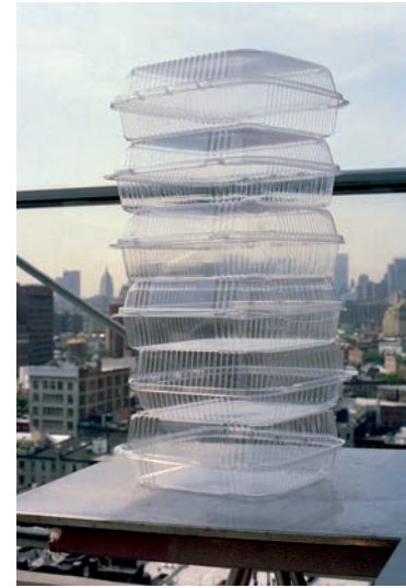
Tower 606, 2006 C-Print, gerahmt Auflage 7 + 1 e.a. 166 x 108 cm

In Sissa Michelis Diptychon „Let this be a dream. NY Times, July 23, 2006“ werden zwei narrativ besetzte Fragmente, fotografisch festgehaltene Augenblicke, miteinander konfrontiert. In ihren Fotografien untersucht die Künstlerin strategisch die Grenzen zwischen Dokumentation und Inszenierung. Die Funktion des Fotografischen, als Abbild der Realität einen Rückbezug zu eben dieser herzustellen, hat sie auf mehreren Ebenen unterlaufen: So verstrickt Micheli reale Ereignisse, Berichte der New York Times, die in den Arbeiten als Titel zitiert sind und den Ausgangspunkt ihrer Fotografien bilden, mit ihrer eigenen Identität: Zum einen, indem sie selbst als Darstellerin ihrer Bilder in die Rolle der Protagonistinnen der Artikel schlüpft. Zum anderen, indem sie die Rekonstruktion der Ereignisse eigenhändig mit der Kamera festhält. Die Befragung der Fotografie auf ihre Grenze zur Fiktion hin äußert sich schließlich auch im klar strukturierten Bildaufbau der Szenen, durch den die Arbeiten sich Gemälden annähern – als komponierten Bildern schlechthin.