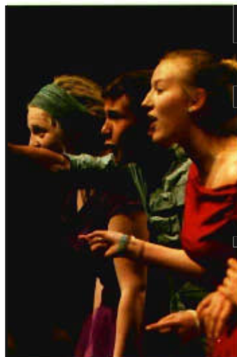
Macht|schule|theater, Produktion Das Märchen vom Sparen

Die Zusammenarbeit von professionellen Theaterleuten mit SchülerInnen ist eine bereichernde und impulsgebende Erfahrung für beide Seiten. Seit dem Schuljahr 2008/2009 haben bereits 65 Theaterhäuser und -gruppen und 154 Schulen teilgenommen. Fast 2.500 SchülerInnen haben aktiv mitgewirkt und über 42.000 ZuschauerInnen haben die Aufführungen gesehen.