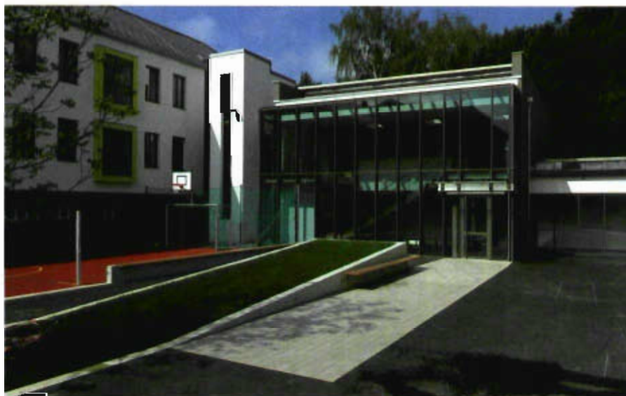
Bücherei Ottensheim

21.975 fast drei Viertel der Veranstaltungen aus und sind ein Zeichen für die aktive Zusammenarbeit der Büchereien mit Kindergärten und Schulen zum Zweck der Leseförderung. Einmal mehr zeigt sich: Ohne das Netz der Öffentlichen Büchereien wäre eine flächendeckende Versorgung mit Literatur in Österreich nicht möglich. Keine andere außerschulische Bildungseinrichtung erreicht derart viele Menschen in Österreich.