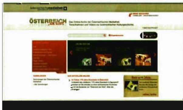
Startseite Österreich am Wort

bar. Neben verschiedenen Recherchemöglichkeiten (einfache Suche, ExpertInnensuche, Empfehlungssystem) bietet ein Zeitleisten-Tool eine intuitive Suche anhand der Zeiträume, denen die Dokumente zugewiesen wurden und ermöglicht damit eine Zeitreise durch den Gesamtbestand der Quellen-Edition.