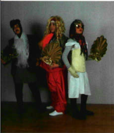
culture connected , Projekt Mix and Match

Das Programm wird von KulturKontakt Austria durchgeführt. Die Abteilung Kulturnetzwerk beteiligte sich an der Finanzierung der dritten Ausschreibung. 25 Partnerschaften wurden von der Jury für eine jährliche Unterstützung in der Höhe von € 3.500,- ausgewählt und nahmen mit Jänner 2012 ihre dreijährige Zusammenarbeit auf. Der Startworkshop am 21. und 22. März 2012 bot Gelegenheit zur Information und Vernetzung aller Beteiligten. Die vierte Ausschreibung von p[ART] im Herbst 2012 richtete sich ausschließlich an berufsbildende mittlere und höhere Schulen. Da fünf Partnerschaften nach drei Jahren mit Ende 2012 ausliefen, wählte die Jury fünf neue Partnerschaften aus.