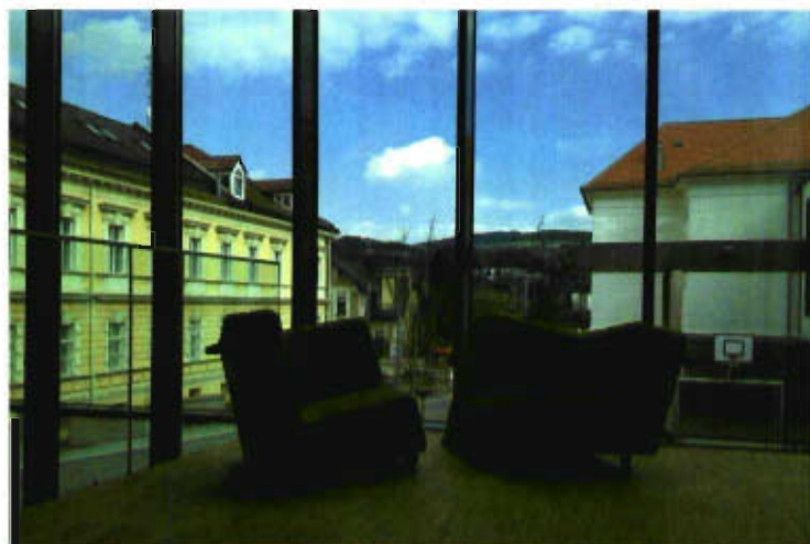
Leselounge Bücherei Ottensheim, Sessel von Wolfgang Gratt

Auch 2012 wurde wieder eine Reihe von Büchereineu- und -umbauten realisiert. So wurden etwa die bugo Bücherei Göfis , die Büchereien in Ottensheim, Hagenberg, Jenbach, Göriach, die Mediathek Maria Anzbach, das Bibliodreieck Weitersfeld-Hardegg-Langau und der Büchertreff Altlichtenwarth feierlich eröffnet, um nur einige zu erwähnen.