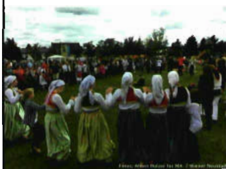
Foto: Flugfeldfest in Wiener Neustadt „Zusammen feiern in Wiener Neustadt“

Das dreijährige Gemeinschaftsprojekt wird vom Verein Initiative Minderheiten – Platform for Minorities in Austria mit dem Romaverein Romano Centro und anderen Vereinen, mit RomavertreterInnen und ExpertInnen sowie mit Kulturverantwortlichen aus allen Bundesländern durchgeführt. Ziel ist die Sichtbarmachung verschiedenster Aspekte der Kultur der Roma und ihrer gelebten Traditionen, um damit bei der Bevölkerung Bewusstsein, Respekt und Wertschätzung für diese Volksgruppe zu schaffen, deren Tradition und Kultur Teil unseres Kulturerbes und kulturellen Lebens sind. Nicht zuletzt soll dieses Projekt auch zur Stärkung des Selbstbewusstseins der Roma selbst beitragen.