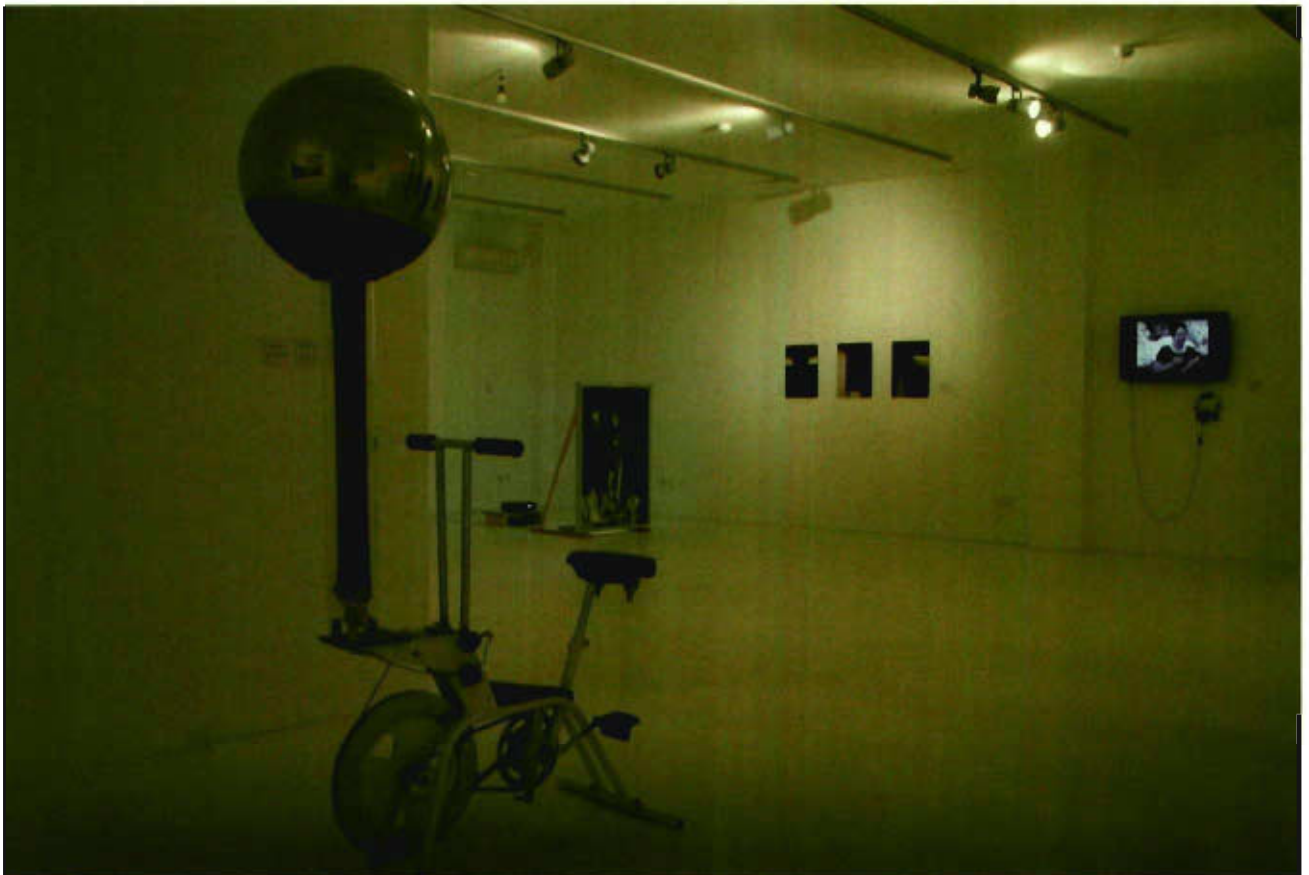
Desiring the Real , © Museum für zeitgenössische Kunst Belgrad

Der Rat der Kulturminister Südosteuropas ist ein Kulturministernetzwerk von elf Ländern (Albanien, Bosnien-Herzegowina, Bulgarien, Griechenland, Kroatien, Montenegro, Rumänien, Serbien, Slowenien, Mazedonien und Türkei), in das Österreich 2008 offiziell als Beobachter aufgenommen wurde, fand 2012 in Belgrad statt. Österreich zeigte die Ausstellung Desiring the Real. Austria Contemporary während der Kulturministerkonferenz im Museum für Zeitgenössische Kunst Belgrad.