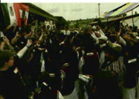
Begeisterter Empfang in einer Schule in Mexiko

Österreich schon tagelang intensiv vorbereitet. Besonders herzlich aufgenommen wurden die jungen Künstler vor allem in den ärmeren Vierteln der Städte und Gemeinden des Landes, deren Bevölkerung das ungewohnte Ereignis eines nur für sie veranstalteten Chorkonzertes, noch dazu eines Chores aus Europa, mit großer Begeisterung und Anteilnahme genoss. Mit ihrer äußerst erfolgreich verlaufenen Konzertreise konnten die St. Florianer Sängerknaben den Ruf Österreichs als Musikland eindrucksvoll unter Beweis stellen.