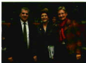
EU-Ministerrat 26. November 2012, Brüssel, Bildungs- und Kulturminister George Demosthenous (Zypern), Kommissarin Androulla Vassiliou, Bundesministerin für Unterricht, Kunst und Kultur Claudia Schmied (Österreich)

Der Vorsitz der Europäischen Union wurde 2012 für jeweils sechs Monate von Dänemark und Zypern wahrgenommen. Der EU-Kulturministerrat tagte am 10. Mai und 26. November in Brüssel.