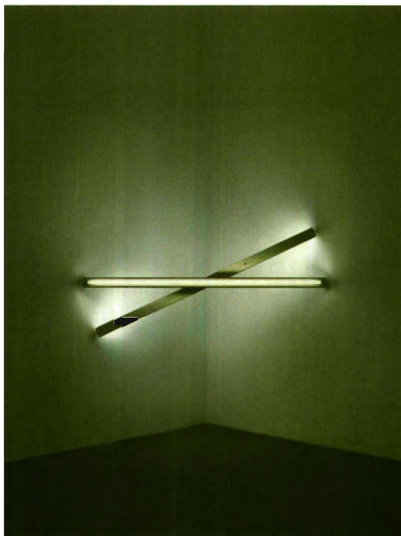
Dan Flavin, Untitled (to Cy Twombly) I , 1972