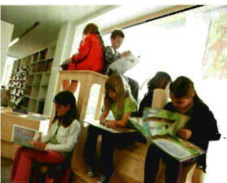
Bücherei Göfis

Das Österreichische Bibliothekswerk hat mit Finanzierung des BMUKK in den letzten 15 Jahren in Kooperation mit 20 weiteren Zeitschriften und Institutionen die umfangreichste frei zugängliche Rezensionsdatenbank im deutschen Sprachraum aufgebaut. In einem weiteren technologischen Entwicklungssprung werden eine Reihe richtungsweisender Features realisiert: Die Medien werden unmittelbar mit globalen, regionalen und lokalen Wissensplattformen vernetzt. Die direkten Anbindungen zu Wikipedia, dem Buchhandel, Universitäten, YouTube und Ähnlichem mehr eröffnen vielfältigste anregende Einstiege in die Welt der Bücher und Medien. Offene Schnittstellen erlauben direkte Einbindung der Informationen in wissenschaftliche Netzwerke sowie uneingeschränkte Datenübernahme durch Öffentliche und Schulbibliotheken. Die Datenbank kann unmittelbar in die Homepages von Bibliotheken