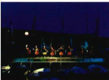
Konzert der Cellisten des Orchesters PurPur im Hafen von Volosko (Opatija), © ad libitum Konzertwerkstatt GmbH

Von der Abteilung für EU-Kulturpolitik wird Projekten, die eine EU-Förderung erhalten, eine Kofinanzierung nach Maßgabe der budgetären Mittel zur Verfügung gestellt. Zudem werden Kulturprojekte mit einem EU-Bezug, etwa anlässlich der EU-Themenjahre, unterstützt.