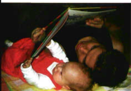
Früh übt sich..., © Simo Huopio

Das Projekt Buchstart: mit Büchern wachsen verfolgt das Ziel, möglichst früh auf Familien mit kleinen Kindern zuzugehen, sie in lokale Netzwerke des Vorlesens, Erzählens und Lernens hereinzunehmen und dauerhaft zu begleiten. Bereits in Hunderten Öffentlichen Büchereien laufen in Kooperation mit schulischen und vorschulischen Einrichtungen wie Krabbelstuben, Eltern-Kind-Gruppen oder Kindergärten solche Buchstart-Initiativen und sorgen für enormes positives Echo.