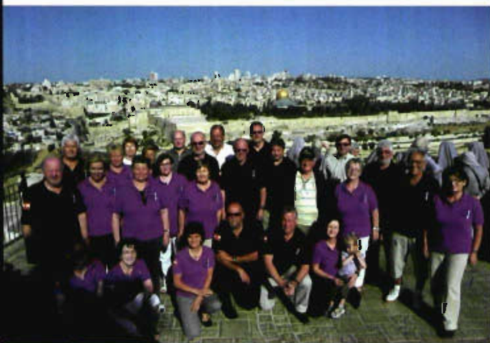
Foto: Die Sängerinnen und Sänger des „chorus lacus felix – gmunden“ über den Dächern von Jerusalem © Andreas Kaltenbrunner

Im Rahmen des dritten großen Förderungsschwerpunktes im Bereich Volkskultur wurden auch 2012 Auslandstourneen sowie Konzert- und Kulturreisen von Musikkapellen, Chören, Volkstanz-, Trachten- und Volksmusikgruppen mit Projektförderungen unterstützt, um damit einen Beitrag zum Ausbau der bilateralen und internationalen Kontaktpflege und zur erfolgreichen Präsentation österreichischer Volkskultur im Ausland zu leisten.