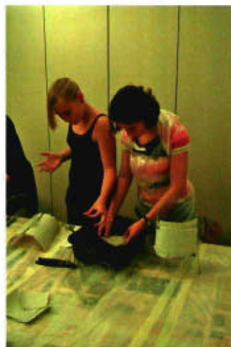
Teilnehmerinnen der Kinderwerkstatt (M)ein Stück Lebenskunst!