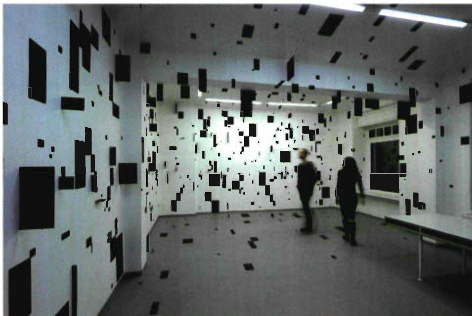
Esther Stocker, Installation , © Ondrej Polak

Für 2013 sind folgende Stationen vorgesehen: Galerie GAALS, Culiacan, Mexiko, Museum für zeitgenössische Kunst Zagreb, Kroatien ( www.msu.hr ), Mazedonisches Nationalmuseum Skopje, Mazedonien ( www.nationalgallery.mk ).