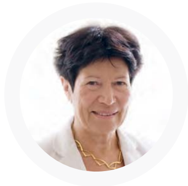
em. Univ.-Prof. in Dr. in Helga Nowotny

Vorstandsvorsitzende der Infineon Technologies Austria AG