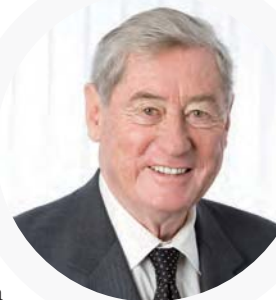
Hannes Androsch Ratsvorsitzender