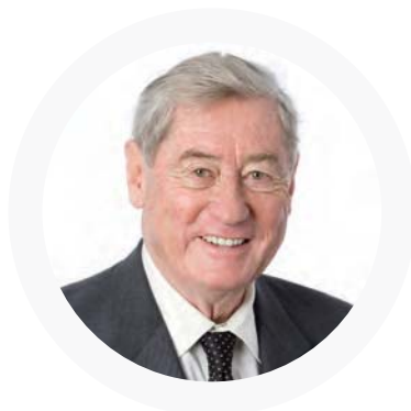
Dkfm. Dr. Hannes Androsch

Ratsvorsitzender Industrieller, Finanzminister und Vizekanzler a. D., ehemaliger Konsulent der Weltbank, Mitglied im Senat der Österreichischen Akademie der Wissenschaften (ÖAW) und Aufsichtsratschef des Austrian Institute of Technology (AIT)