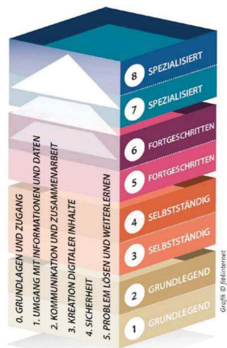
Abbildung 3: Digitales Kompetenzmodell

Österreich hat 2018/19 eine Weiterentwicklung an dem Modell DigComp 2.1 vorgenommen und am 28. Jänner 2019 als „Digitales Kompetenzmodell für Österreich - DigComp 2.2. AT“ publiziert. In Österreich arbeitet die Taskforce „Digitale Kompetenzen“ - interdisziplinäres Beratungsgremium mit Mitgliedern aus Wissenschaft, Wirtschaft, Erwachsenenbildung und Verwaltung - an der laufenden Weiterentwicklung des Kompetenzmodells.