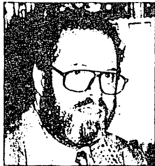
Hier liegt offenbar ein klassischer Fall von Schwarzarbeit vor. Die Wirtschaftskammer erstattet Anzeige.