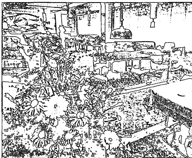
Verschoben wurde der Ausbau des Linzer Casinos. Aber der Automatenaal wird vergrößert.

sich seit der Gründung des Casinos auf 106 verdoppelt. Ottitsch, der seit Beginn in Linz Direktor ist, geht mit Jahresende in Pension. Wer Nachfolger wird, steht noch nicht fest.