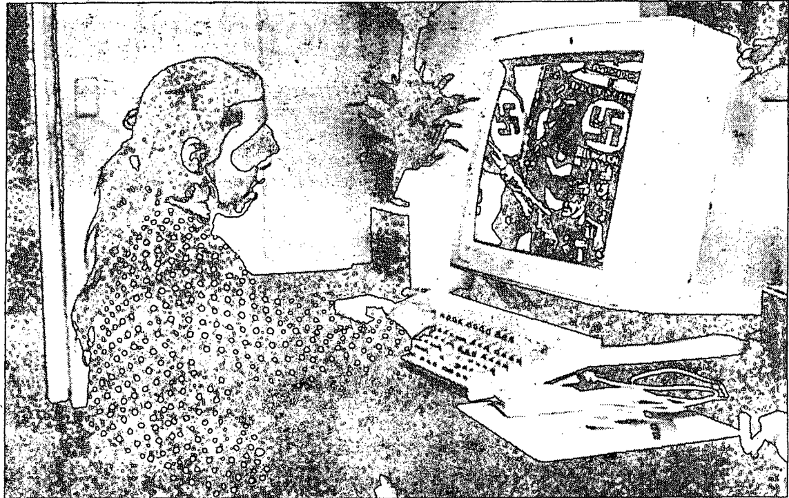
„Heil Dir im Hakenkreuz, Führer des Deutschen Reichs...“ Spielend werden Juden vergast

Die Absicht, die die unbekanntesten Hersteller der menschenverachtenden Spiele haben, ist klar: „Die Kinder sollen spielerisch im Sinne von Einspielen an Inhumanität und Menschenverachtung gewöhnt werden“, analysiert David Wohlhart, Computerpädagoge aus Graz, den Hintergrund der immer massiver werdenden nazistischen Propagandaattacken. Auch bei einem weiteren Wirtschaftssimulationsspiel – „KZ-Manager“ genannt – müssen die Jugendlichen einen grausamen Standpunkt vertreten, um das Spiel zu gewinnen: