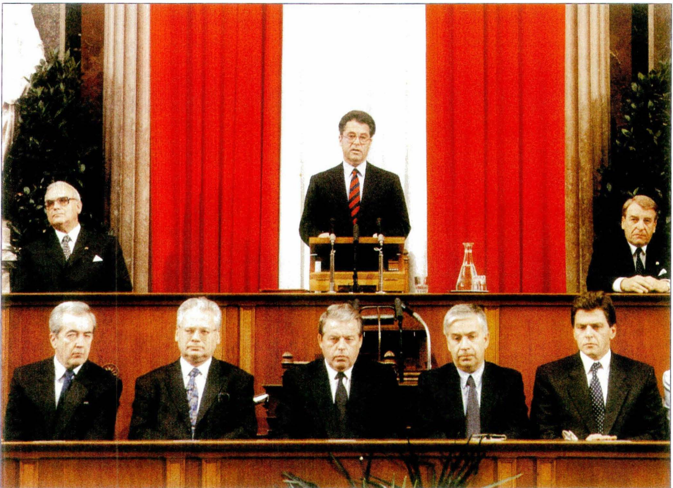
Der Präsident des Nationalrates Dr. Heinz Fischer bei seiner Ansprache

Herr Bundespräsident! Ihre Amtszeit war — soweit ich es beobachten konnte — durch eine sehr gute Zusammenarbeit mit den anderen Staatsorganen ausgezeichnet. Das