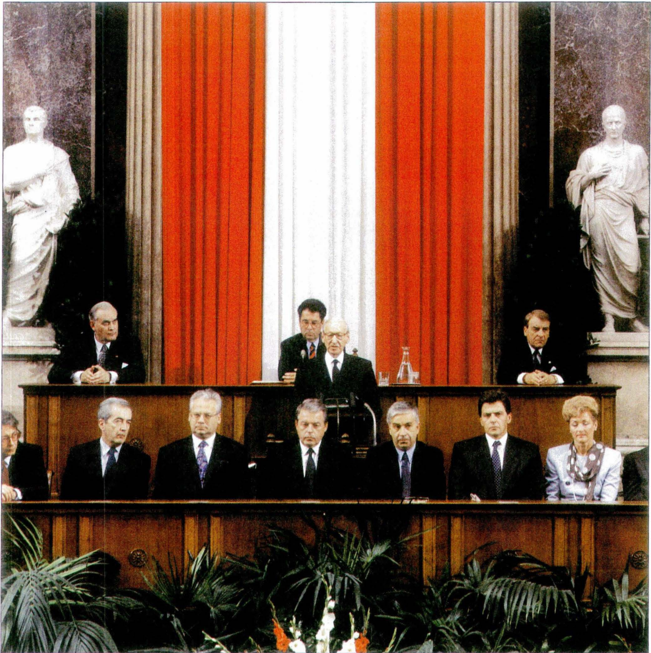
Bundespräsident Dr. Kurt Waldheim bei seiner Ansprache

des Parlaments deutlich wird. Es ist ein Festtag für unsere Republik, wenn sich das frei gewählte Parlament ohne Unterschied der politischen Überzeugung versammelt, um den Wechsel des Staatsoberhauptes im Geist großer Harmonie zu vollziehen. Ich weiß, wie viele Nationen uns gerade um solche Errungenschaften beneiden.