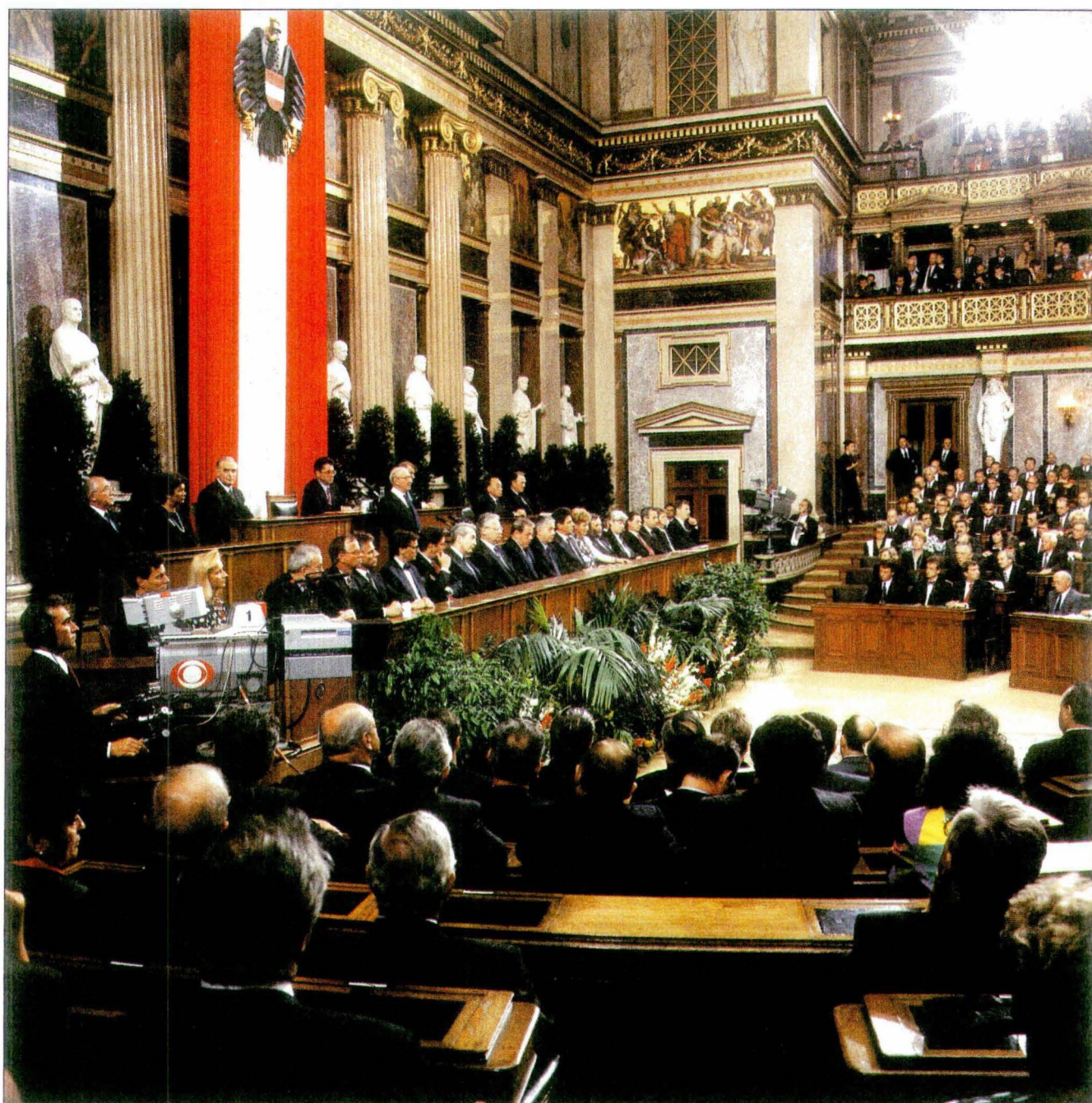
Bundespräsident Dr. Kurt Waldheim verabschiedet sich von den Mitgliedern des Nationalrates und des Bundesrates

Kriegsgeneration pauschal mit dem nationalsozialistischen Regime in Zusammenhang zu bringen oder gar gleichzusetzen. Es kam mir darauf an, klarzustellen, daß jene furchtbare Schuld, die dieses Regime auf sich geladen hat und an der leider auch nicht wenige Österreicher mitgewirkt haben, nicht auf das Gros unserer Bürgerinnen und Bürger aufgeteilt werden dürfe. Es war mir wichtig, festzustellen, daß die Mehrheit von ihnen in einen Krieg geschickt wurde, den sie nicht wollte, daß sie eine Uniform tragen mußte, die für viele Völker — insbesondere für das jüdische Volk — zu einem Symbol für Verfolgung, Elend und Tod wurde, und daß Millionen Menschen dieser Kriegsgeneration meist erst nach dem Krieg von der Art, dem tatsächlichen Ziel und dem schrecklichen Ausmaß dieser Verbrechen erfuhren.