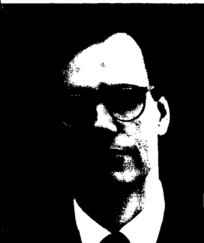
Mit meinen besten Wünschen