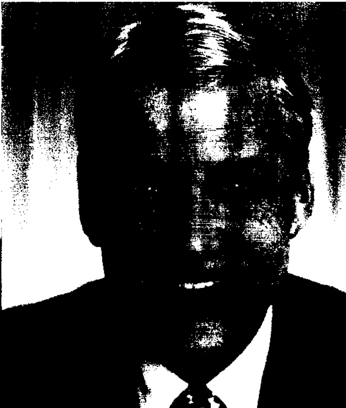
Mit meinen besten Wünschen