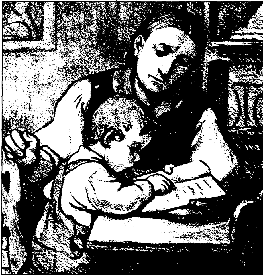
Eine Mutter lehrt ihr Kind die Muttersprache

„Die deutsche Sprache ist, unbeschadet der den sprachlichen Minderheiten bundesgesetzlich eingeräumten Rechte, die Staatssprache der Republik.“