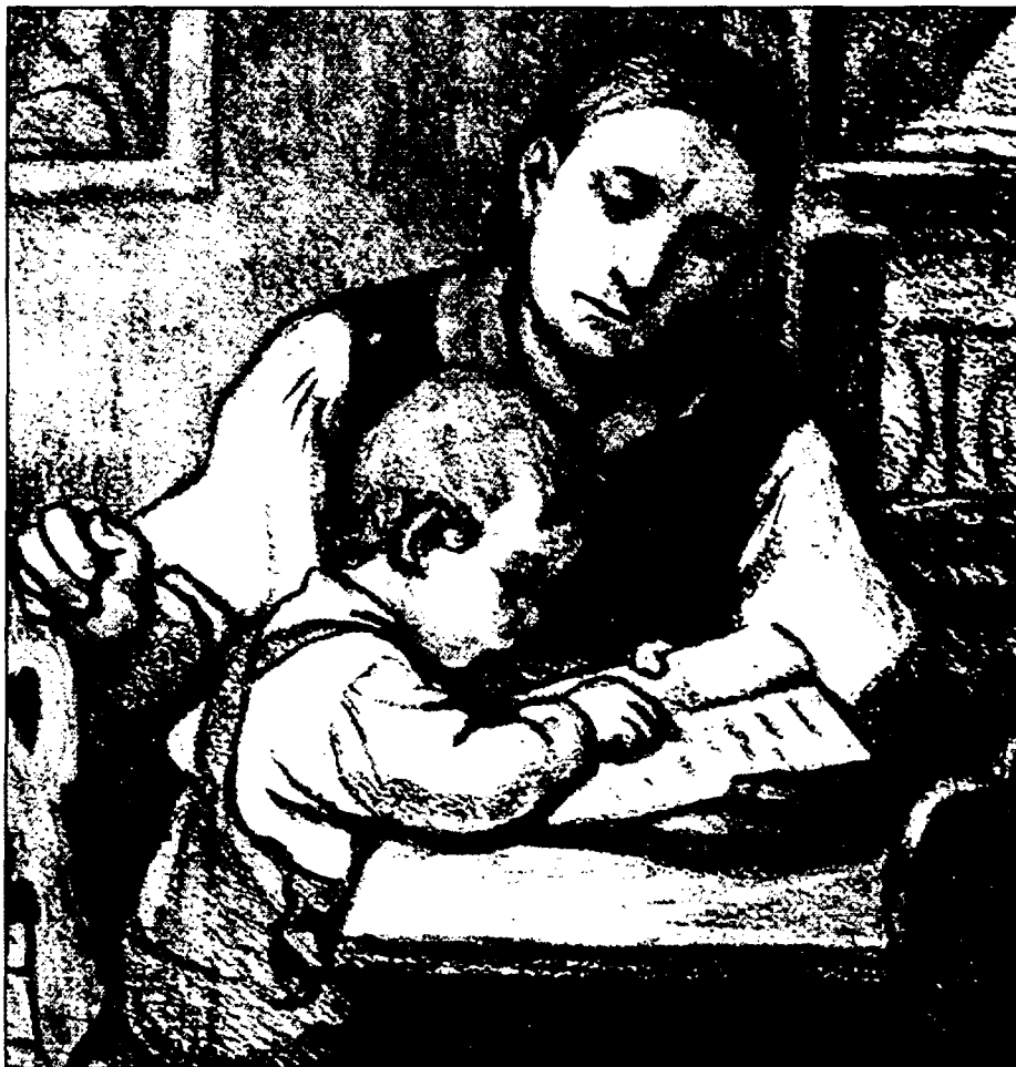
Eine Mutter lehrt ihr Kind die Muttersprache

„Die deutsche Sprache ist, unbeschadet der den sprachlichen Minderheiten bundesgesetzlich eingeräumten Rechte, die Staatssprache der Republik.“