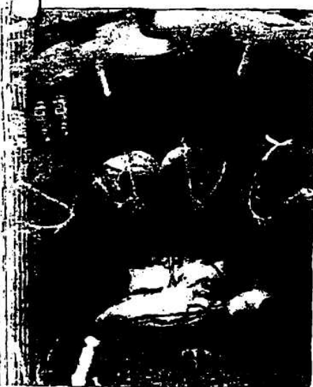
Der „Uni-Professor“ (48) aus der Ukraine operiert noch immer als Chirurg in einem Wiener Privatspital

seinem Professorentitel wissen will der Arzt mit einem Ablenkungs-Redeschwall verdrängen. Schließlich hätte er „den Titel ohnehin in der Ukraine redlich“ erworben - auf einer Urin Transkarpatien. R