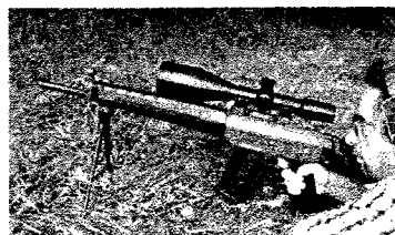
Matchversion mit Parker Hale Zweibein geschossen im Liegendanschlag

Die breite Information durch die auch in Österreich gelesenen Magazine hatte Auswirkungen: Der IWÖ-Beratungsdienst wurde viel öfters als früher in Anspruch genommen um die rechtlichen Gegebenheiten bei halbautomatischen Langwaffen