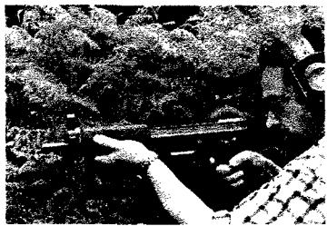
Kurzversion mit 24 cm Lauflänge

Halbautomatische Schußwaffen sind nach den Bestimmungen des österreichischen Waffengesetzes Waffen, die auf Waffenpaß/Waffenbesitzkarte erhältlich sind - sofern es sich nicht um Kriegsmaterial handelt. Diese letzte Einschränkung, die auch im Vorläufer des jetzigen