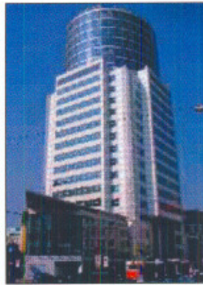
Galaxy Tower, Wien: Sitz der Bundeswettbewerbsbehörde

Der Rechtsschutz stößt an im österreichischen Ver-