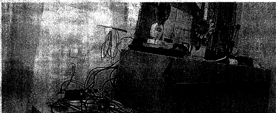
Desolates Wachzimmer in Wien: In der Vergangenheit halfen die Polizeifreunde bei der Renovierung. Künftig muss das Innenministerium zahlen.

Im Zuge einer Prüfung stellte der Rechnungshof in seinem Bericht III-48 diverse Missstände in der Verwaltung und Bewirtschaftung von Gebäuden, Anlagen und Einrichtungen in Bereichen des Bundesministeriums für europäische und internationale Angelegenheiten fest. Da nicht auszuschließen ist, dass auch im Bundesministerium für Inneres diesbezüglich Missstände bestehen und dem Begleittext zu einem Foto in der Tageszeitung „Die Presse“ vom 7.11.2007