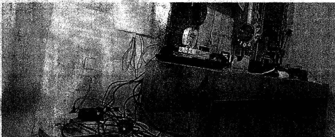
Desolates Wachzimmer in Wien: In der Vergangenheit halfen die Polizeifreunde bei der Renovierung. Künftig muss das Innenministerium zahlen. (3. November 2007)

Im Zuge einer Prüfung stellte der Rechnungshof in seinem Bericht III-48 diverse Missstände in der Verwaltung und Bewirtschaftung von Gebäuden, Anlagen und Einrichtungen in Bereichen des Bundesministeriums für europäische und internationale Angelegenheiten fest. Da nicht auszuschließen ist, dass auch im Bundesministerium für Inneres diesbezüglich Missstände bestehen und dem Begleittext zu einem Foto in der Tageszeitung „Die Presse“ vom 7.11.2007