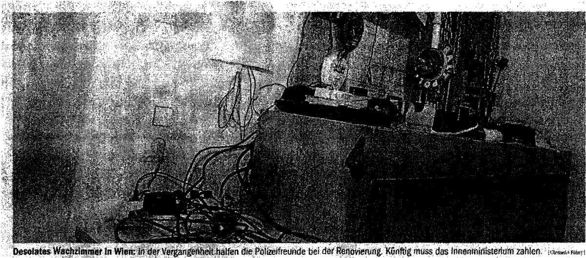
Desolates Wachzimmer in Wien: In der Vergangenheit halfen die Polizeifreunde bei der Renovierung. Künftig muss das Innenministerium zahlen.

Im Zuge einer Prüfung stellte der Rechnungshof in seinem Bericht III-48 diverse Missstände in der Verwaltung und Bewirtschaftung von Gebäuden, Anlagen und Einrichtungen in Bereichen des Bundesministeriums für europäische und internationale Angelegenheiten fest. Da nicht auszuschließen ist, dass auch im Bundesministerium für Inneres diesbezüglich Missstände bestehen und dem Begleittext zu einem Foto in der Tageszeitung „Die Presse“ vom 7.11.2007