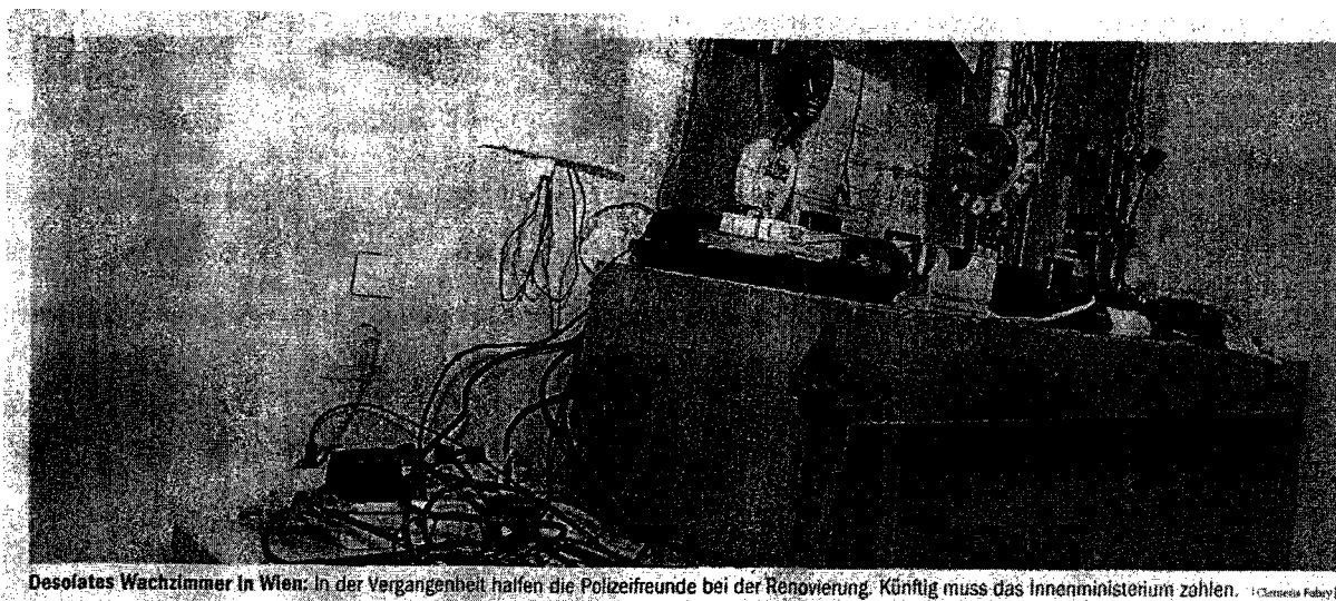
Desolates Wachzimmer in Wien: In der Vergangenheit halfen die Polizeifreunde bei der Renovierung. Künftig muss das Innenministerium zahlen. (Clemens Faber)

Im Zuge einer Prüfung stellte der Rechnungshof in seinem Bericht III-48 diverse Missstände in der Verwaltung und Bewirtschaftung von Gebäuden, Anlagen und Einrichtungen in Bereichen des Bundesministeriums für europäische und internationale Angelegenheiten fest. Da nicht auszuschließen ist, dass auch im Bundesministerium für Inneres diesbezüglich Missstände bestehen und dem Begleittext zu einem Foto in der Tageszeitung „Die Presse“ vom 7.11.2007