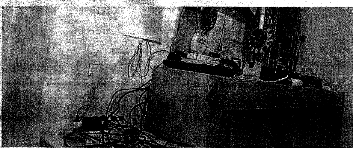
Desolates Wachzimmer in Wien: In der Vergangenheit halfen die Polizeifreunde bei der Renovierung. Künftig muss das Innenministerium zahlen. (Österreich) Kabov

Im Zuge einer Prüfung stellte der Rechnungshof in seinem Bericht III-48 diverse Missstände in der Verwaltung und Bewirtschaftung von Gebäuden, Anlagen und Einrichtungen in Bereichen des Bundesministeriums für europäische und internationale Angelegenheiten fest. Da nicht auszuschließen ist, dass auch im Bundesministerium für Inneres diesbezüglich Missstände bestehen und dem Begleittext zu einem Foto in der Tageszeitung „Die Presse“ vom 7.11.2007