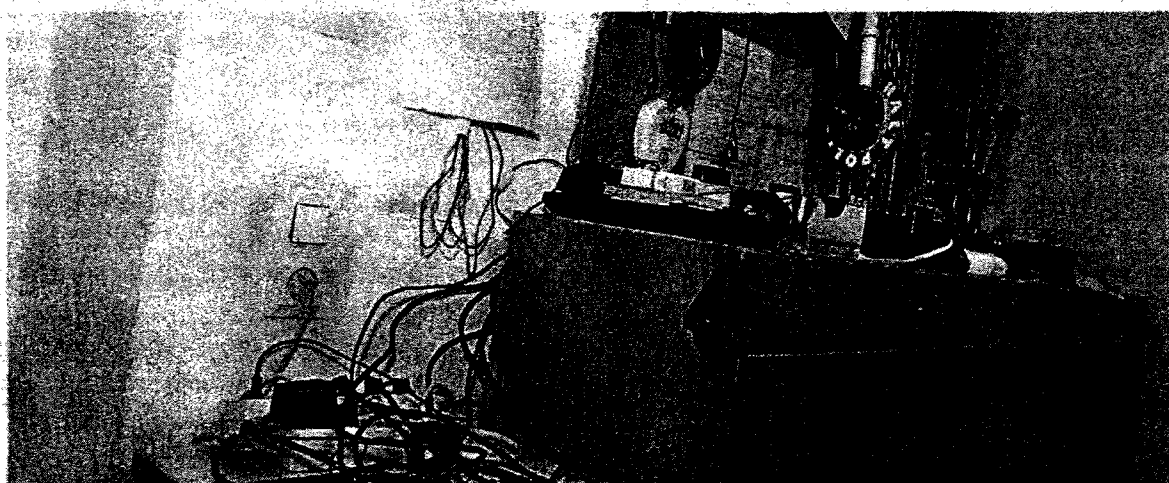
Desolates Wachzimmer in Wien: In der Vergangenheit halfen die Polizeifreunde bei der Renovierung. Künftig muss das Innenministerium zahlen.

Im Zuge einer Prüfung stellte der Rechnungshof in seinem Bericht III-48 diverse Missstände in der Verwaltung und Bewirtschaftung von Gebäuden, Anlagen und Einrichtungen in Bereichen des Bundesministeriums für europäische und internationale Angelegenheiten fest. Da nicht auszuschließen ist, dass auch im Bundesministerium für Inneres diesbezüglich Missstände bestehen und dem Begleittext zu einem Foto in der Tageszeitung „Die Presse“ vom 7.11.2007