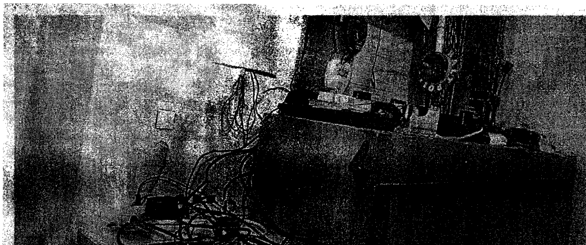
Desolates Wachzimmer in Wien: In der Vergangenheit halfen die Polizeifreunde bei der Renovierung. Künftig muss das Innenministerium zahlen. (Gemeinsch. Foto)

Im Zuge einer Prüfung stellte der Rechnungshof in seinem Bericht III-48 diverse Missstände in der Verwaltung und Bewirtschaftung von Gebäuden, Anlagen und Einrichtungen in Bereichen des Bundesministeriums für europäische und internationale Angelegenheiten fest. Da nicht auszuschließen ist, dass auch im Bundesministerium für Inneres diesbezüglich Missstände bestehen und dem Begleittext zu einem Foto in der Tageszeitung „Die Presse“ vom 7.11.2007