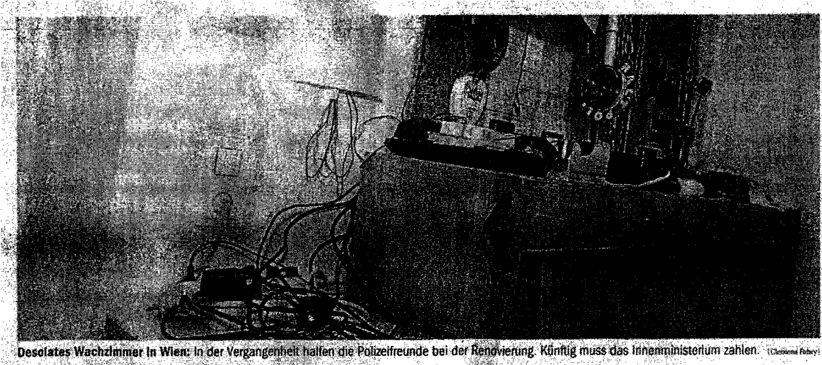
Desolates Wachzimmer in Wien: In der Vergangenheit halfen die Polizeifreunde bei der Renovierung. Künftig muss das Innenministerium zahlen.

Im Zuge einer Prüfung stellte der Rechnungshof in seinem Bericht III-48 diverse Missstände in der Verwaltung und Bewirtschaftung von Gebäuden, Anlagen und Einrichtungen in Bereichen des Bundesministeriums für europäische und internationale Angelegenheiten fest. Da nicht auszuschließen ist, dass auch im Bundesministerium für Inneres diesbezüglich Missstände bestehen und dem Begleittext zu einem Foto in der Tageszeitung „Die Presse“ vom 7.11.2007