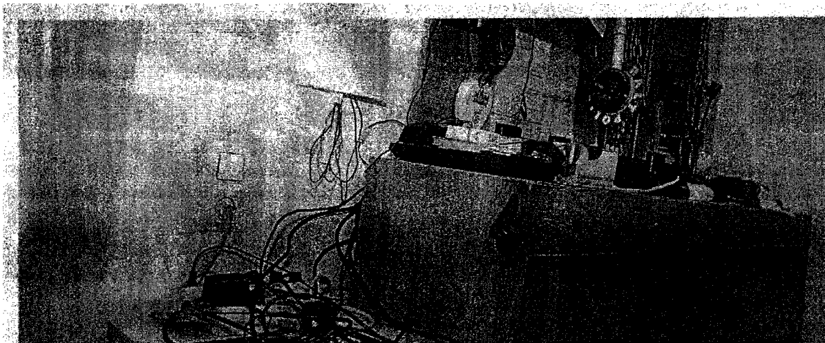
Desolates Wachzimmer in Wien: In der Vergangenheit halfen die Polizeifreunde bei der Renovierung. Künftig muss das Innenministerium zahlen. (Günter Feber)

Im Zuge einer Prüfung stellte der Rechnungshof in seinem Bericht III-48 diverse Missstände in der Verwaltung und Bewirtschaftung von Gebäuden, Anlagen und Einrichtungen in Bereichen des Bundesministeriums für europäische und internationale Angelegenheiten fest. Da nicht auszuschließen ist, dass auch im Bundesministerium für Inneres diesbezüglich Missstände bestehen und dem Begleittext zu einem Foto in der Tageszeitung „Die Presse“ vom 7.11.2007