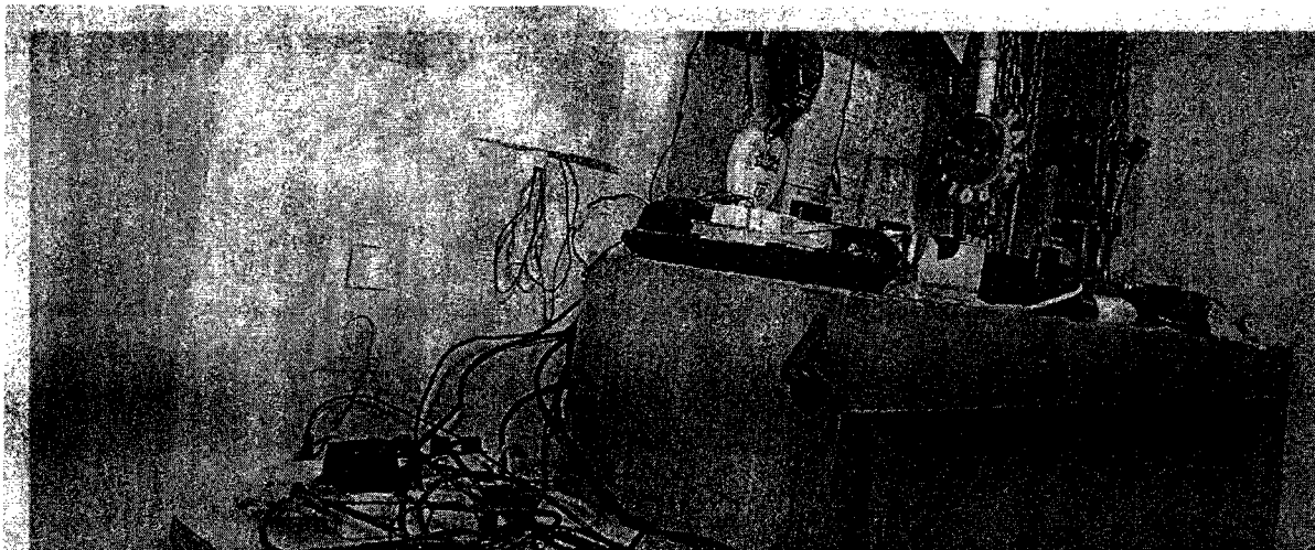
Desolates Wachzimmer in Wien: In der Vergangenheit hatten die Polizeifreunde bei der Renovierung. Künftig muss das Innenministerium zahlen.

Im Zuge einer Prüfung stellte der Rechnungshof in seinem Bericht III-48 diverse Missstände in der Verwaltung und Bewirtschaftung von Gebäuden, Anlagen und Einrichtungen in Bereichen des Bundesministeriums für europäische und internationale Angelegenheiten fest. Da nicht auszuschließen ist, dass auch im Bundesministerium für Inneres diesbezüglich Missstände bestehen und dem Begleittext zu einem Foto in der Tageszeitung „Die Presse“ vom 7.11.2007