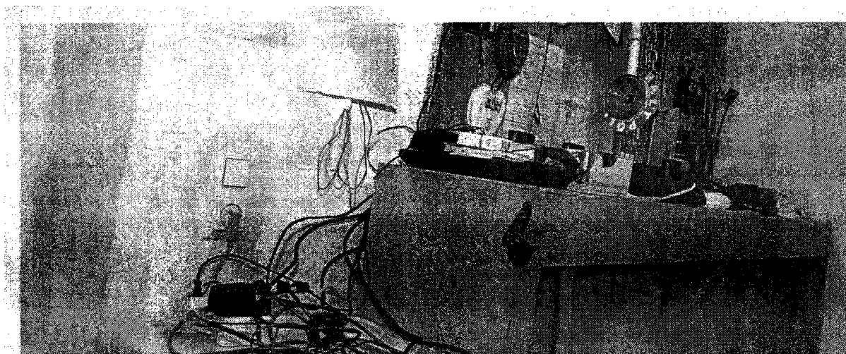
Desolates Wachzimmer in Wien: In der Vergangenheit halfen die Polizeifreunde bei der Renovierung. Künftig muss das Innenministerium zahlen. (Christoph Fehrer)

Im Zuge einer Prüfung stellte der Rechnungshof in seinem Bericht III-48 diverse Missstände in der Verwaltung und Bewirtschaftung von Gebäuden, Anlagen und Einrichtungen in Bereichen des Bundesministeriums für europäische und internationale Angelegenheiten fest. Da nicht auszuschließen ist, dass auch im Bundesministerium für Inneres diesbezüglich Missstände bestehen und dem Begleittext zu einem Foto in der Tageszeitung „Die Presse“ vom 7.11.2007