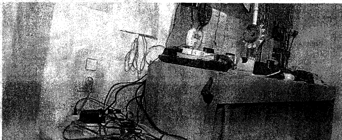
Desolates Wachzimmer in Wien: In der Vergangenheit halfen die Polizeifreunde bei der Renovierung. Künftig muss das Innenministerium zahlen.

Im Zuge einer Prüfung stellte der Rechnungshof in seinem Bericht III-48 diverse Missstände in der Verwaltung und Bewirtschaftung von Gebäuden, Anlagen und Einrichtungen in Bereichen des Bundesministeriums für europäische und internationale Angelegenheiten fest. Da nicht auszuschließen ist, dass auch im Bundesministerium für Inneres diesbezüglich Missstände bestehen und dem Begleittext zu einem Foto in der Tageszeitung „Die Presse“ vom 7.11.2007