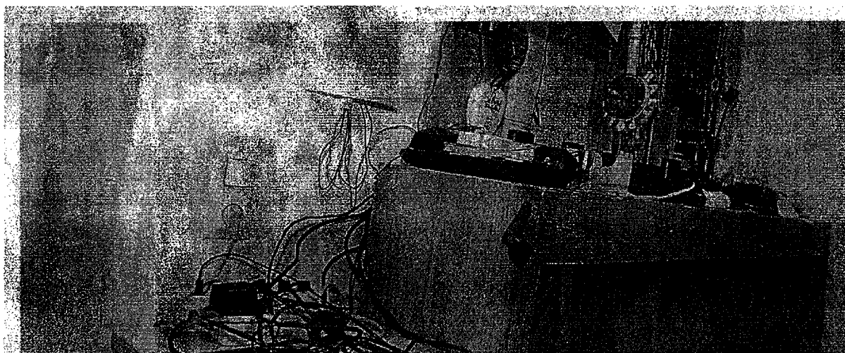
Desolates Wachzimmer in Wien: In der Vergangenheit halfen die Pöblzeifreunde bei der Renovierung. Künftig muss das Innenministerium zahlen.

Im Zuge einer Prüfung stellte der Rechnungshof in seinem Bericht III-48 diverse Missstände in der Verwaltung und Bewirtschaftung von Gebäuden, Anlagen und Einrichtungen in Bereichen des Bundesministeriums für europäische und internationale Angelegenheiten fest. Da nicht auszuschließen ist, dass auch im Bundesministerium für Inneres diesbezüglich Missstände bestehen und dem Begleittext zu einem Foto in der Tageszeitung „Die Presse“ vom 7.11.2007