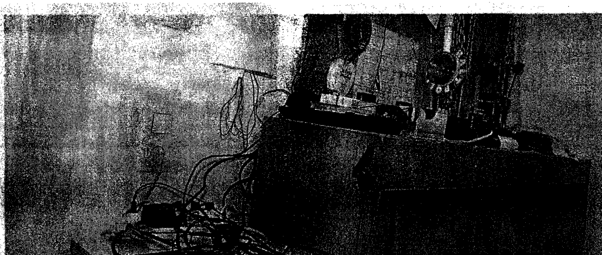
Desolates Wachzimmer in Wien: In der Vergangenheit halfen die Polizeifreunde bei der Renovierung. Künftig muss das Innenministerium zahlen.

Im Zuge einer Prüfung stellte der Rechnungshof in seinem Bericht III-48 diverse Missstände in der Verwaltung und Bewirtschaftung von Gebäuden, Anlagen und Einrichtungen in Bereichen des Bundesministeriums für europäische und internationale Angelegenheiten fest. Da nicht auszuschließen ist, dass auch im Bundesministerium für Inneres diesbezüglich Missstände bestehen und dem Begleittext zu einem Foto in der Tageszeitung „Die Presse“ vom 7.11.2007