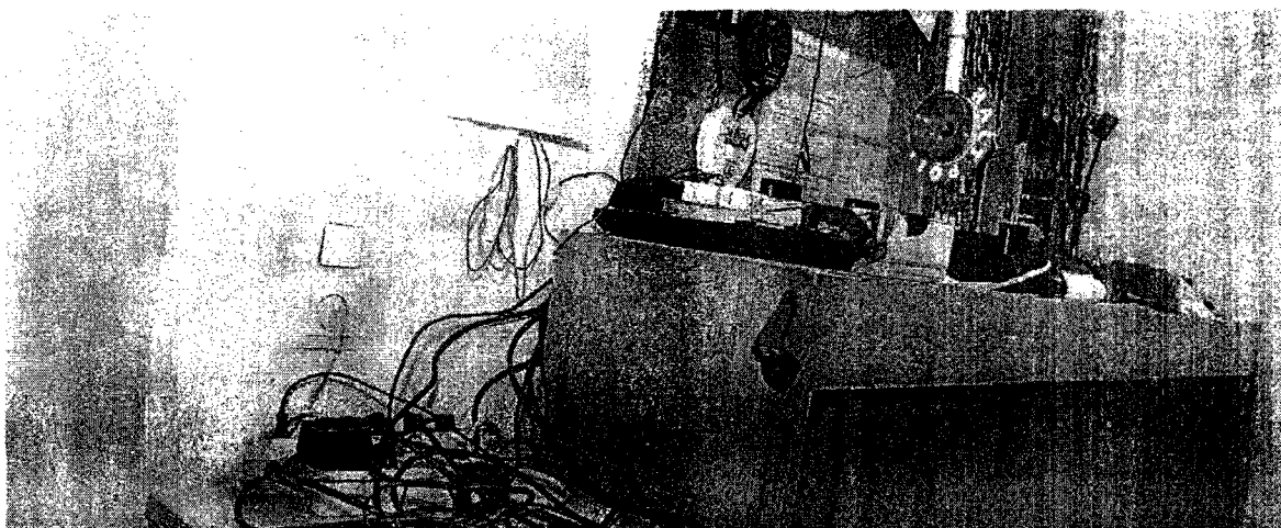
Desolates Wachzimmer in Wien: In der Vergangenheit halfen die Polizeifreunde bei der Renovierung. Künftig muss das Innenministerium zahlen.

Im Zuge einer Prüfung stellte der Rechnungshof in seinem Bericht III-48 diverse Missstände in der Verwaltung und Bewirtschaftung von Gebäuden, Anlagen und Einrichtungen in Bereichen des Bundesministeriums für europäische und internationale Angelegenheiten fest. Da nicht auszuschließen ist, dass auch im Bundesministerium für Inneres diesbezüglich Missstände bestehen und dem Begleittext zu einem Foto in der Tageszeitung „Die Presse“ vom 7.11.2007