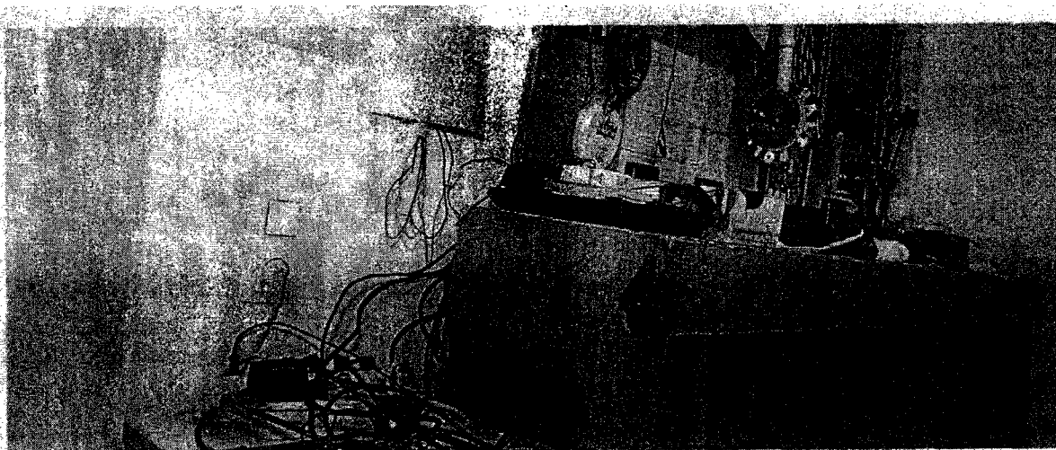
Desolates Wachzimmer in Wien: In der Vergangenheit halfen die Polizeifreunde bei der Renovierung. Künftig muss das Innenministerium zahlen.

Im Zuge einer Prüfung stellte der Rechnungshof in seinem Bericht III-48 diverse Missstände in der Verwaltung und Bewirtschaftung von Gebäuden, Anlagen und Einrichtungen in Bereichen des Bundesministeriums für europäische und internationale Angelegenheiten fest. Da nicht auszuschließen ist, dass auch im Bundesministerium für Inneres diesbezüglich Missstände bestehen und dem Begleittext zu einem Foto in der Tageszeitung „Die Presse“ vom 7.11.2007