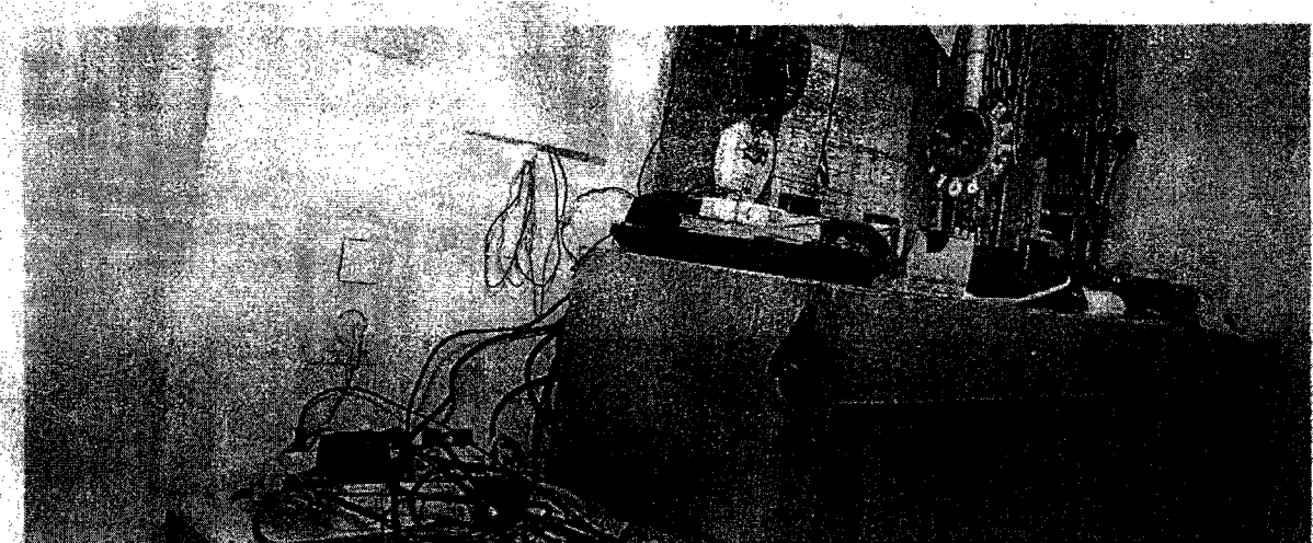
Desolates Wachzimmer in Wien: In der Vergangenheit halfen die Polizeifreunde bei der Renovierung. Künftig muss das Innenministerium zahlen.

Im Zuge einer Prüfung stellte der Rechnungshof in seinem Bericht III-48 diverse Missstände in der Verwaltung und Bewirtschaftung von Gebäuden, Anlagen und Einrichtungen in Bereichen des Bundesministeriums für europäische und internationale Angelegenheiten fest. Da nicht auszuschließen ist, dass auch im Bundesministerium für Inneres diesbezüglich Missstände bestehen und dem Begleittext zu einem Foto in der Tageszeitung „Die Presse“ vom 7.11.2007