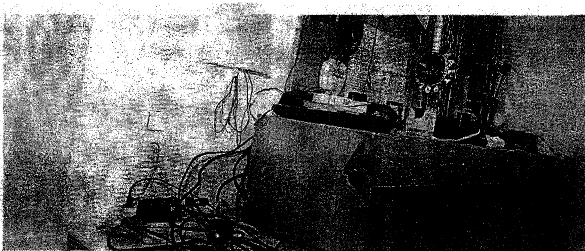
Desolates Wachzimmer in Wien: In der Vergangenheit halfen die Polizeifreunde bei der Renovierung. Künftig muss das Innenministerium zahlen.

Im Zuge einer Prüfung stellte der Rechnungshof in seinem Bericht III-48 diverse Missstände in der Verwaltung und Bewirtschaftung von Gebäuden, Anlagen und Einrichtungen in Bereichen des Bundesministeriums für europäische und internationale Angelegenheiten fest. Da nicht auszuschließen ist, dass auch im Bundesministerium für Inneres diesbezüglich Missstände bestehen und dem Begleittext zu einem Foto in der Tageszeitung „Die Presse“ vom 7.11.2007