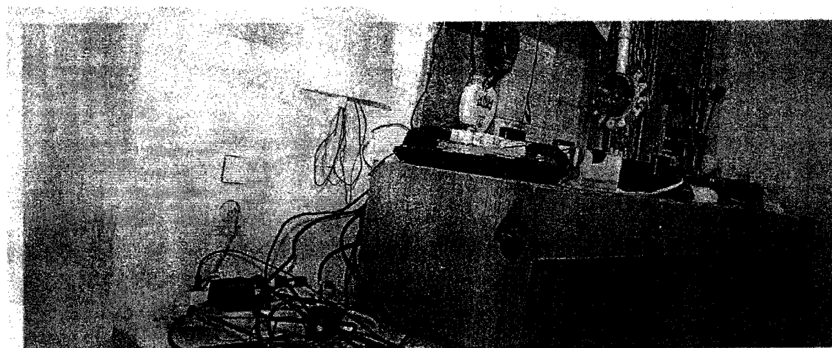
Desolates Wachzimmer in Wien: In der Vergangenheit halfen die Polizeifreunde bei der Renovierung. Künftig muss das Innenministerium zahlen.

Im Zuge einer Prüfung stellte der Rechnungshof in seinem Bericht III-48 diverse Missstände in der Verwaltung und Bewirtschaftung von Gebäuden, Anlagen und Einrichtungen in Bereichen des Bundesministeriums für europäische und internationale Angelegenheiten fest. Da nicht auszuschließen ist, dass auch im Bundesministerium für Inneres diesbezüglich Missstände bestehen und dem Begleittext zu einem Foto in der Tageszeitung „Die Presse“ vom 7.11.2007