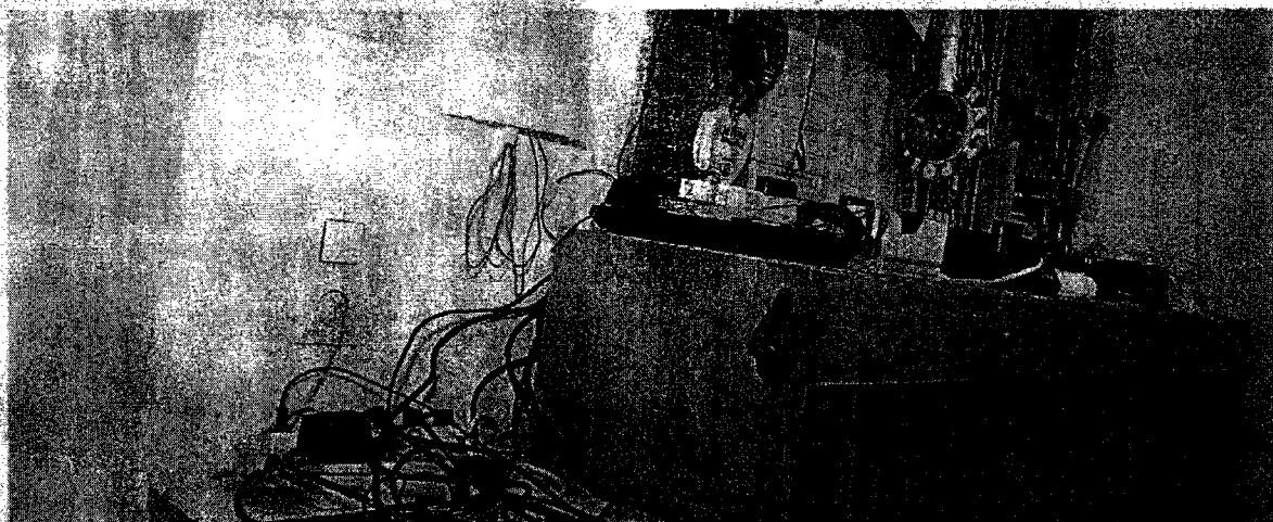
Desolates Wachzimmer in Wien: In der Vergangenheit halfen die Polizeifreunde bei der Renovierung. Künftig muss das Innenministerium zahlen. (Christoph Fehrer)

Im Zuge einer Prüfung stellte der Rechnungshof in seinem Bericht III-48 diverse Missstände in der Verwaltung und Bewirtschaftung von Gebäuden, Anlagen und Einrichtungen in Bereichen des Bundesministeriums für europäische und internationale Angelegenheiten fest. Da nicht auszuschließen ist, dass auch im Bundesministerium für Inneres diesbezüglich Missstände bestehen und dem Begleittext zu einem Foto in der Tageszeitung „Die Presse“ vom 7.11.2007