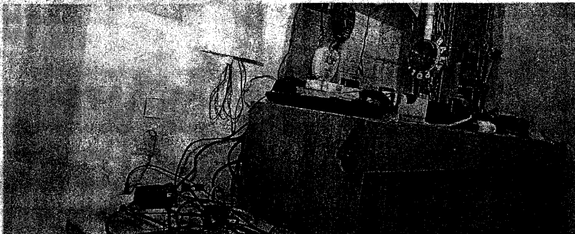
Desolates Wachzimmer in Wien: In der Vergangenheit hatten die Polizeifreunde bei der Renovierung. Künftig muss das Innenministerium zahlen. (Claremonta Fabry)

Im Zuge einer Prüfung stellte der Rechnungshof in seinem Bericht III-48 diverse Missstände in der Verwaltung und Bewirtschaftung von Gebäuden, Anlagen und Einrichtungen in Bereichen des Bundesministeriums für europäische und internationale Angelegenheiten fest. Da nicht auszuschließen ist, dass auch im Bundesministerium für Inneres diesbezüglich Missstände bestehen und dem Begleittext zu einem Foto in der Tageszeitung „Die Presse“ vom 7.11.2007